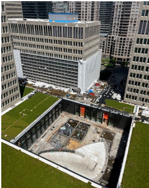
Photo : Le bâtiment Hearst, dans le coin supérieur gauche, est entouré d'échafaudages et de bâches, tandis que les travaux sur le toit

Tout au long de l'été, la communauté peut s'attendre à voir les échafaudages commencer à être retirés des tours Hearst et Hepburn.